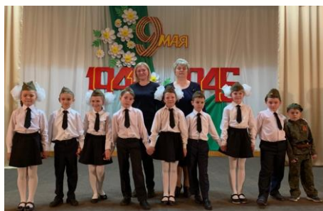
Клуб-филиал пос. Усть-Мана