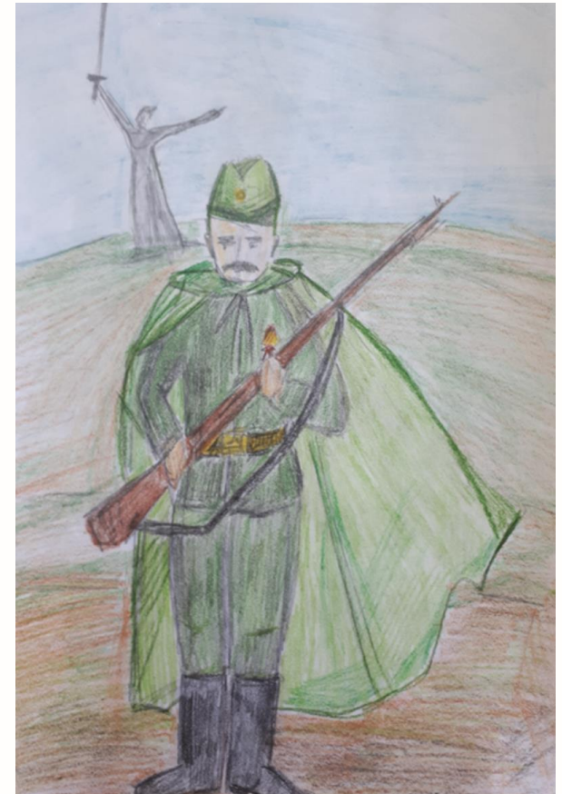
Рисунок Цалко Глеба, обучающегося 7 Б класса