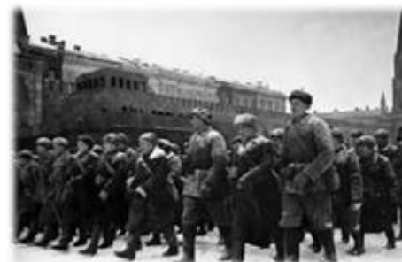
Парад на Красной Площади, 1941 год

149-ой танковой бригады 30-го автополка 36-го отдельного автотранспортного батальона. Был ранен. После выздоровления воевал на Первом Украинском фронте под командованием Рокоссовского. Дошёл до Берлина и распалился на одной из колон Рейхстага. Вернулся домой, работал водителем в ДОЗ с. Овсянка. Умер 14 сентября 1990 г.