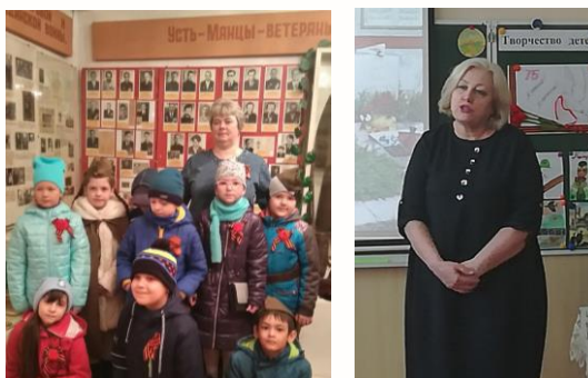
Народный краеведческий музей пос. Усть-Мана